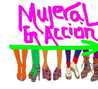
MUJERAL EN ACCIÓN