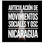
ARTICULACIÓN DE MOVIMIENTOS SOCIALES