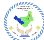
MOVIMIENTO AUTOCONVOCADOS DE EL VIEJO