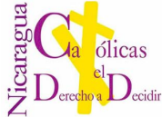
CATÓLICAS POR EL DERECHO A DECIDIR NICARAGUA