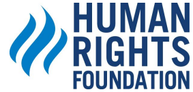
HUMAN RIGHTS FOUNDATION