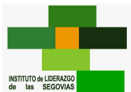
INSTITUTO DE LIDERAZGO DE LAS SEGOVIAS