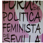
FORUM DE POLÍTICA FEMINISTA DE SEVILLA