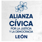
ALIANZA CÍVICA POR LA JUSTICIA Y LA DEMOCRACIA - LEÓN