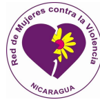
RED DE MUJERES CONTRA LA VIOLENCIA